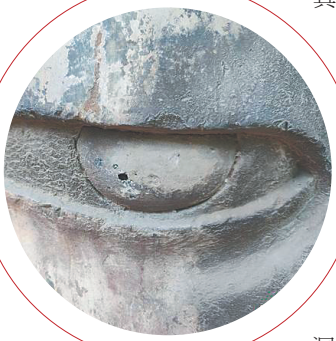
新发现的琉璃眼珠。

值得一提的是，此次修复工程对奉先寺内的造像、题记、建筑遗迹等信息都制作了充分的全息记录和数字化档案，为将来的检测修复、展示保护和考古研究等工作提供有力的数据支持。