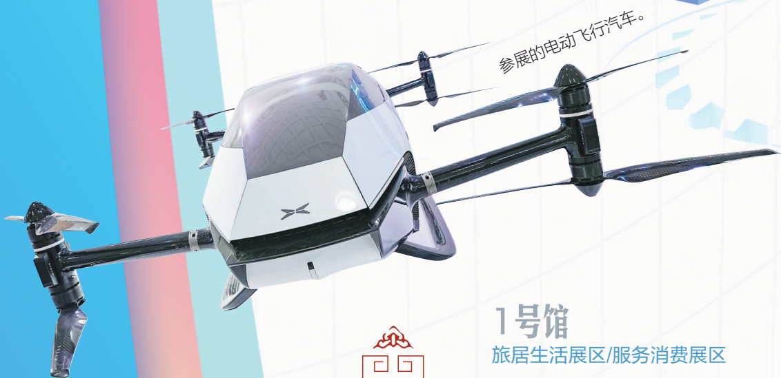
参展的电动飞行汽车。

分享本版内容请扫二维码 (见报当日八时更新) 整理/本报记者 陈雪怡 制图/张昕