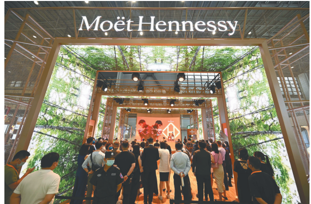
酩悦轩尼诗举行新品发布活动。

泡酒等。 香槟家族中的佼佼者——黑桃A香槟在本届消博会上迎来首度亮相。据介绍，酩悦轩尼诗于2021年与黑桃A建立战略合作伙伴关系，希望通过消博会这个消费精品展示平台，将品质出众的黑桃A香槟介绍给中国的年轻消费者。 酩悦轩尼诗在本届消博会上另一个重磅展品则是桃红葡萄酒“蝶之兰”。据悉，蝶之兰拥有多元化的产品，如蝶之兰城堡天使密语桃红葡萄酒、蝶之兰城堡摇曳天使桃红葡萄酒、蝶之兰城堡大天使桃红葡萄酒等。酩悦轩尼诗希望借力消博会这一全新消费机遇，继续加大蝶之兰推广力度，传递独特的桃红美学。