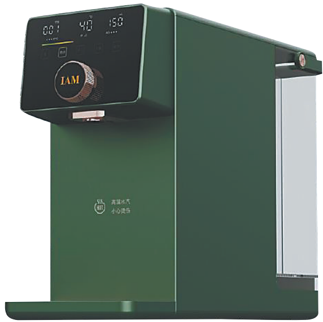
IAM“热水机”亮相消博会。

样需要自己选择饮水量和温度。奇妙之处在于，“热水机”完成从沸腾到降温的全过程，只需要短短3秒。 据展台工作人员介绍，该款产品集成了RO反渗透净水技术和iHe's即热即冷热水系统，依靠新一代稀土厚膜加热技术，能瞬间将水加热至100℃，同时在ICS板式骤冷技术的加持下，短短3秒就能让100℃的开水骤降到40℃。 (本报海口7月26日讯)