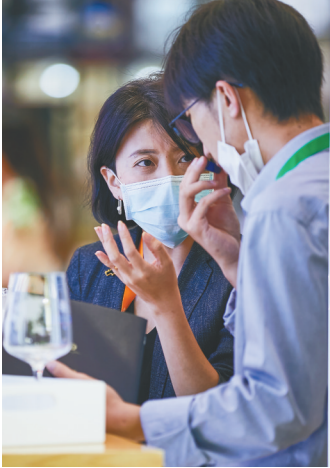
在位于3号馆的诺迪思展馆,工作人员为嘉宾介绍该品牌酒类饮品。