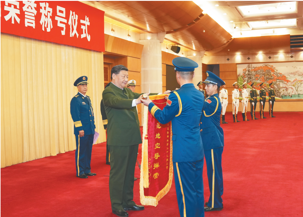
七月二十七日，中央军委颁授“八一勋章”和荣誉称号仪式在北京八一大楼隆重举行。中共中央总书记、国家主席、中央军委主席习近平向“八一勋章”获得者颁授勋章和证书，向获得荣誉称号的单位颁授荣誉奖旗。这是习近平同获得荣誉称号的单位颁授荣誉奖旗。