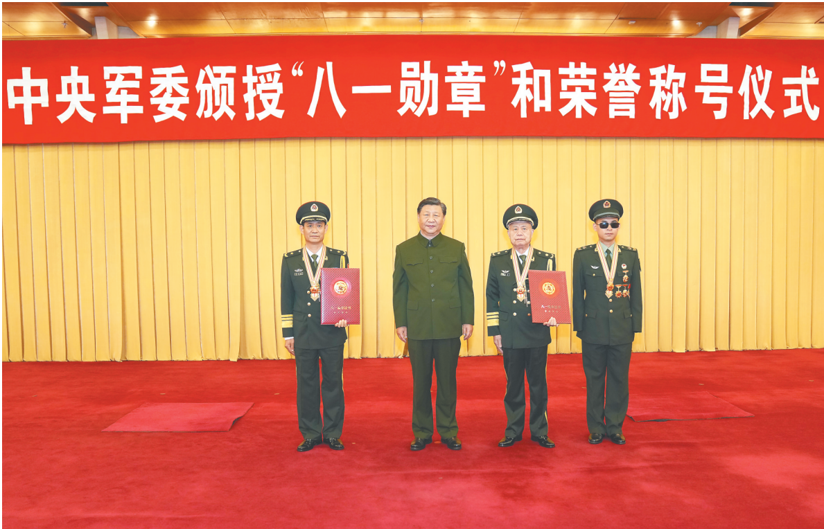
七月二十七日，中央军委颁授“八一勋章”和荣誉称号仪式在北京八一大楼隆重举行。中共中央总书记、国家主席、中央军委主席习近平向“八一勋章”获得者颁授勋章和证书，向获得荣誉称号的单位颁授荣誉奖旗。这是习近平同获得“八一勋章”的同志集体合影。