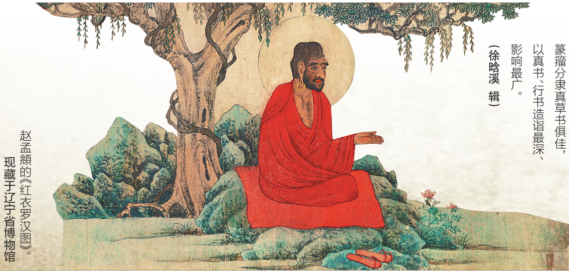
赵孟頫的《红衣罗汉图》。现藏于辽宁省博物馆