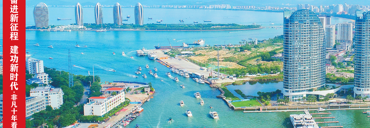
在三亚河入海口，一艘艘游艇出港。丰富多彩的游艇出海游产品和水上项目，当前正成为三亚新的旅游消费热点。