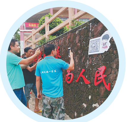
乐东抱邱村村民扫码查看村务信息。