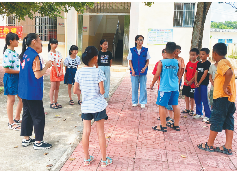
在澄迈金江镇太平责任区博芳小学,支教大学生与孩子玩游戏。

调解当日,特邀调解员和法律援助律师从情、理、法三个维度,向当事人耐心释法,通过联合调解,当事人最终达成调解协议,双方积累多年的矛盾终于解开。 据悉,此案是该法院发挥“特邀调解员+法律援助律师”联合调解方式的缩影,从恢复审理到结案仅历时2天,在做到快速结案的同时,有效化解双方当事人的矛盾纠纷,促进双方当事人互谅互让,实现了法律效果和社会效果的统一。