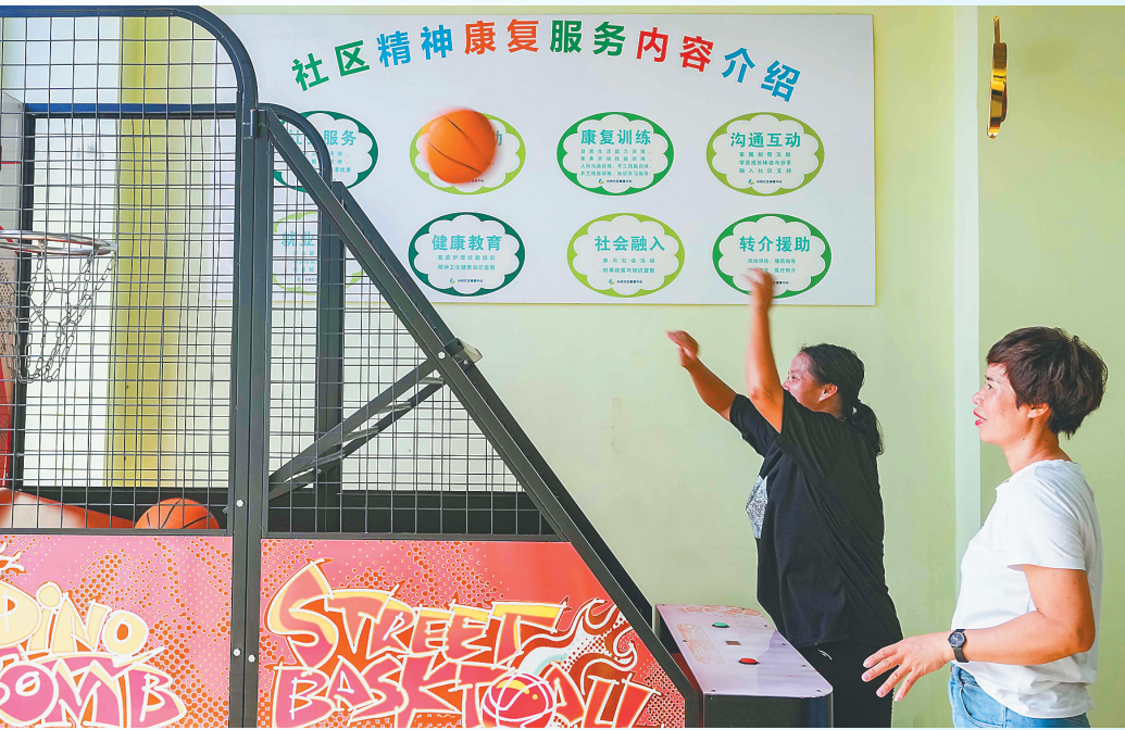
在澄迈县社区精神康复中心,医护人员为患者提供康复训练服务。

“为确保农房抗震改造工作的顺利完成,保障广大群众生命财产安全,我县实行‘县镇同步逐户验收’制度,在改造项目竣工后,由县住建局组织各镇相关人员和改造农户、建筑工匠等,严格按照相关现行验收规范要求,逐户、逐项对照《海南省农房抗震改造竣工验收表》内容进行全面验收。”澄迈县住房和城乡建设局负责人告诉记者,截至目前,该县已动工改造179户,动工率为100%,已竣工178户,竣工率为99.4%,提前完成年初制定的阶段性目标。(本报金江8月4日电)