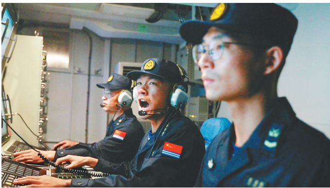
八月六日，海军某舰正在进行主炮系统操演。