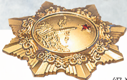
一级独立自由勋章(仿真品)。