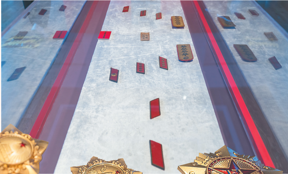
张云逸的肩章、领章。

这些展品向我们展示出张云逸从一个反帝反封建的旧民主主义革命者,到加入中国共产党,成为一个自觉的共产主义者的历程。