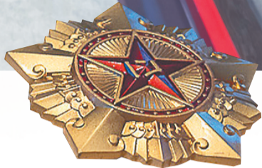
一级八一勋章(仿真品)。