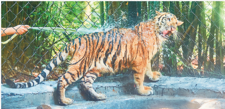
天气一热，小老虎“多多”就很喜欢饲养员在它身上喷水。

空调房水帘洞、瀑布山、高顶棚……保育员们除了在喂食和淋浴等方面为动物们出了各种消暑妙招外，还会根据不同动物的习性，为它们打造遮阳纳凉的栖息地。