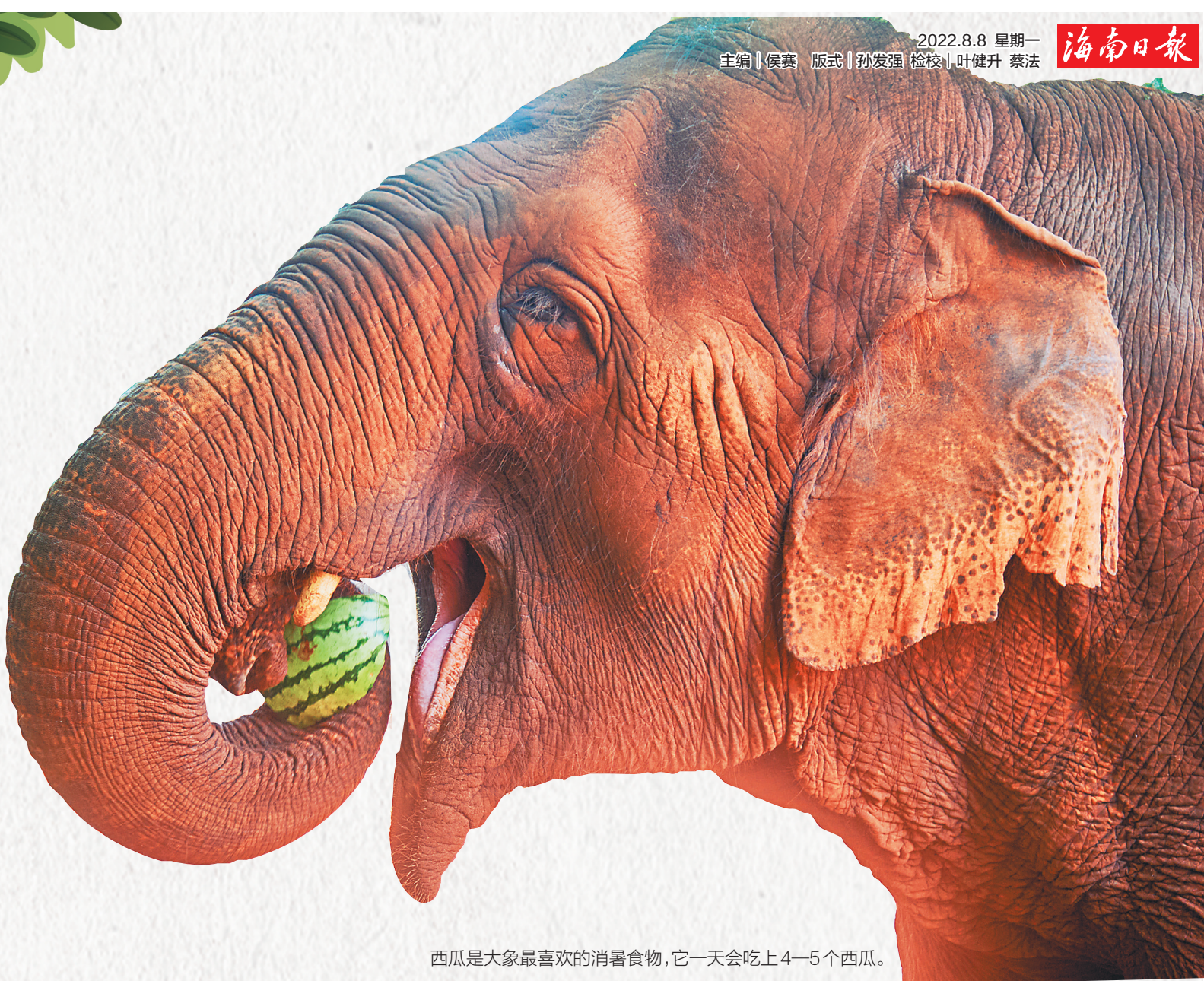
西瓜是象最喜欢的消暑食物，它一天会吃上4—5个西瓜。