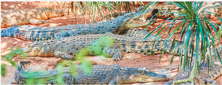
鳄鱼在树荫下乘凉。