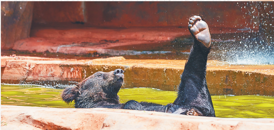
在户外棕熊馆里，一只棕熊躺在水边乘凉休息。