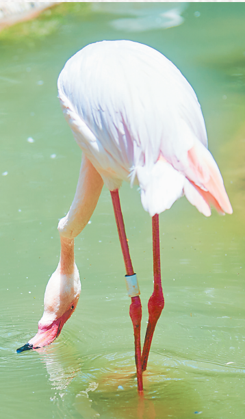
火烈鸟在炎炎夏日中上演“倒挂饮水”绝活。

与河马鳄鱼相比，猕猴们就好动许多。为了缓解酷热，它们会用自己湿漉漉的舌头，一会儿舔舔毛茸茸的前臂，一会儿舔舔下肢。鸟类家族也不消停，它们会通过喘息让热量通过肺部和气囊排出体外。