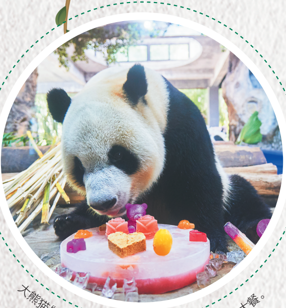
大熊猫“舜舜”正在享用饲养员为它准备的解暑大餐。

虽已立秋，但海岛依然暑气未消。尤其到了午后，气温攀升，湿热的空气容易使人无精打采，动物们也不例外。面对阵阵暑气，动物们会怎样避暑消暑？动物园的保育员们又会有哪些帮助动物消暑的妙招？一起跟随海南日报记者的镜头，去寻觅动物们的消暑“凉方”。