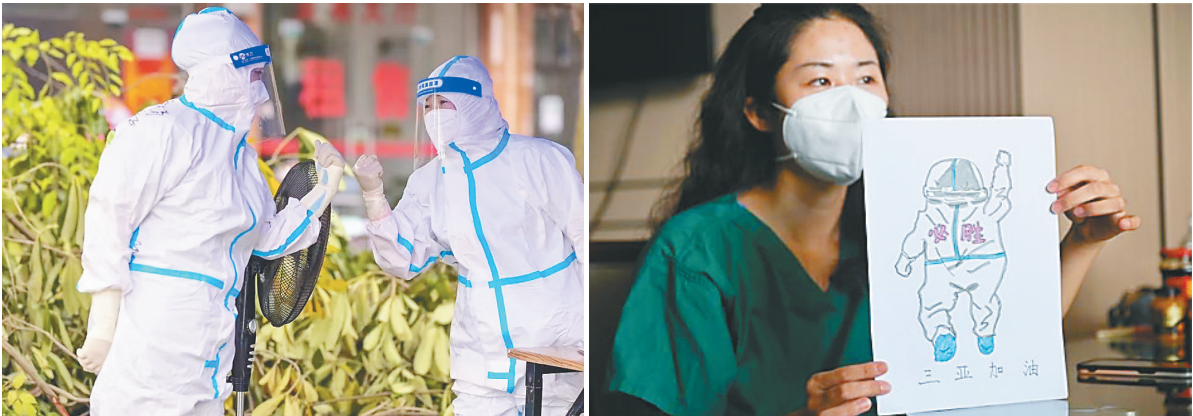
“大白”们互相加油鼓劲。