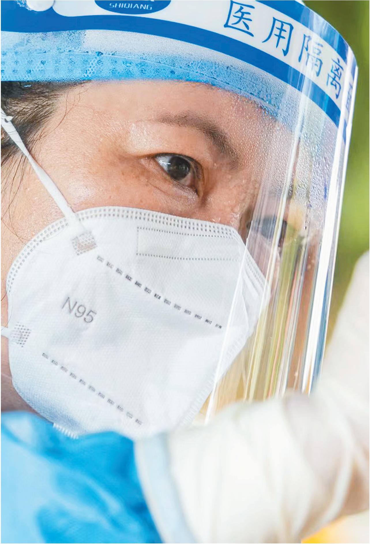
一名医务人员在专注进行核酸采样。