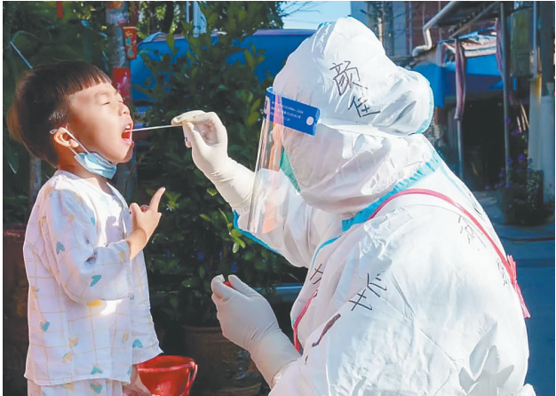
一位医务人员给小男孩做核酸采样。