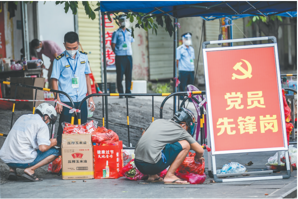
8月20日,东方市严格落实社会面管控。图为永安东路居龙新村村口,群众线上下单,身穿隔离服的工作人员送货上门。