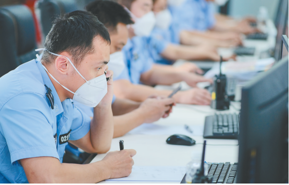
8月17日,三亚值班民警加班加点进行阳性患者的追踪调查工作。