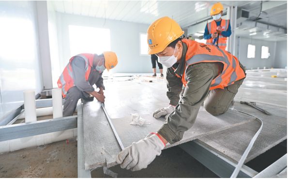
8月10日,工人在三亚第二方舱医院作业。