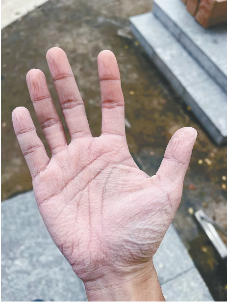
医护人员被汗水浸皱的手。