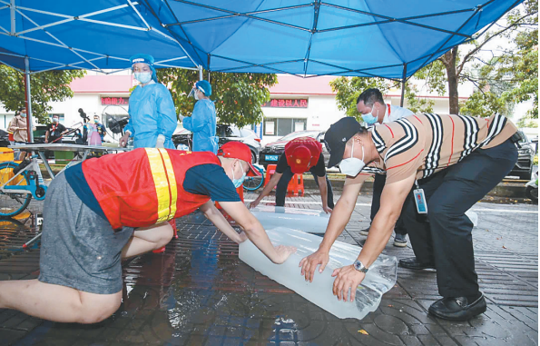
志愿者在采样点为医护人员放置冰块。