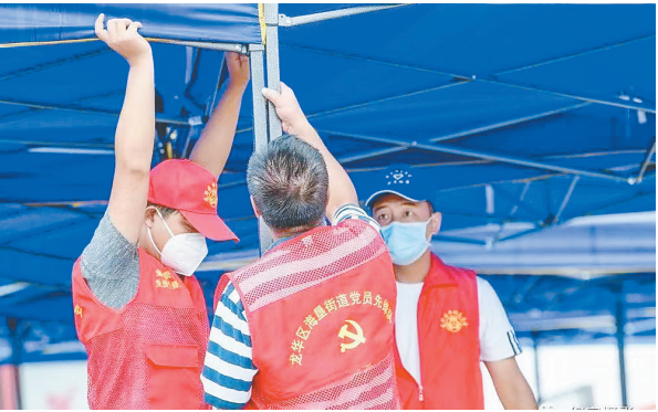
8月8日,志愿者在忙碌布置采样点。