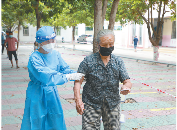
8月17日,乐乐九所镇中心学校核酸采样点,医护人员协助行动不便的市民进行核酸采样。