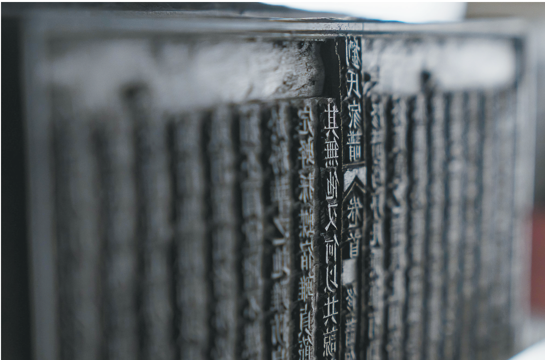
2019年以来,海南省图书馆地方文献与古籍部从民间搜集到了500余块家谱雕版。