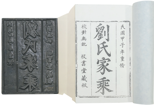
海南省图书馆地方文献与古籍部收藏的《刘氏家乘》雕版和再印件。