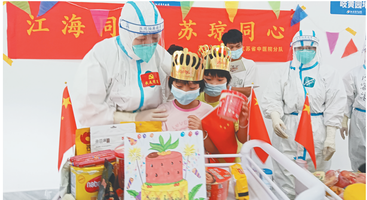
8月23日，德州二号方舱医院D舱内，江苏援琼医疗队方舱队为小朋友过生日。

8月23日下午，生日会开始。除了过生日的孩子，医护人员还把其他孩子喊来一起参加生日会。江苏援琼医疗队方舱队相关负责人代表全