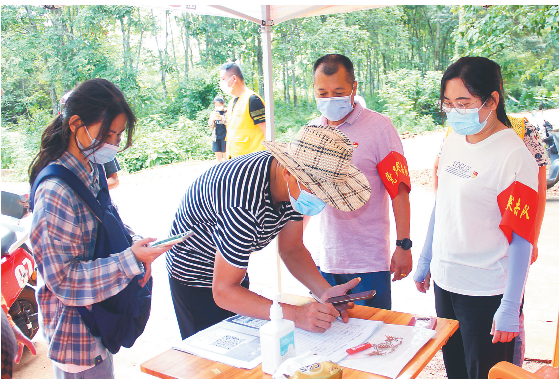
临高县财政局党员突击队在临城镇文新村卡点进行值守,对进出人员进行扫码、登记。

疫情期间,临高县各级党组织充分发挥战斗堡垒作用,落实各项防疫措施,为疫情防控工作提供坚强的组织保障和人力支持。全县157个机关和企事业单位的4800余名工作人员、500名乡村振兴工作队、272名公安干警、1000余名社会工作者、173名民兵积极响应号召,投身抗疫一线,成立党员抗疫先锋队 and 防疫