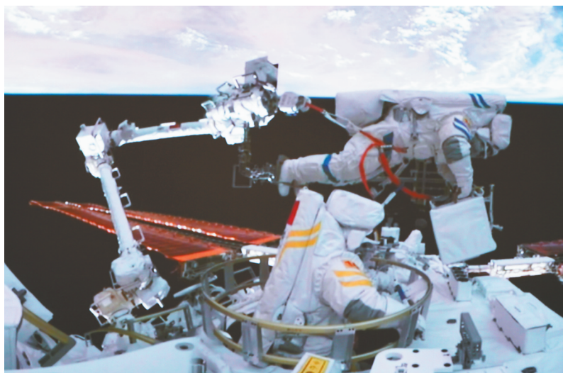
航天员陈冬(上)、刘洋(下)开展舱外操作的画面。

这是我国航天员首次从问天实验舱气闸舱出舱实施舱外活动,也是陈冬、刘洋首次执行出舱活动任务。