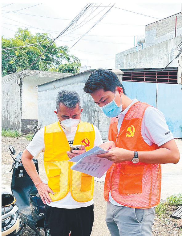
临高县临城镇纪委工作人员检查辖区内居家隔离人员情况。

《关于进一步强化作风 压实责任 坚决打赢疫情防控攻坚战的通知》,把疫情防控主战场当作练兵场,在疫情防控一线开展当先锋作表率创先争优活动,营造“比学赶超”良好氛围。