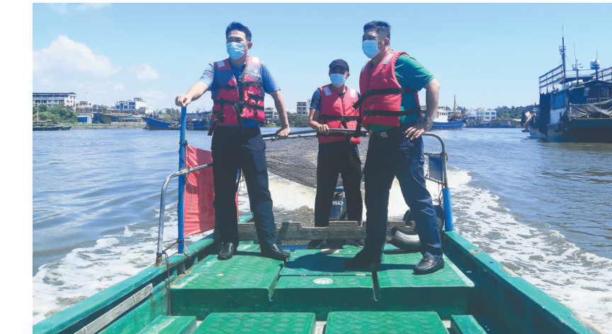
琼海市农业农村局党员在海上巡查。