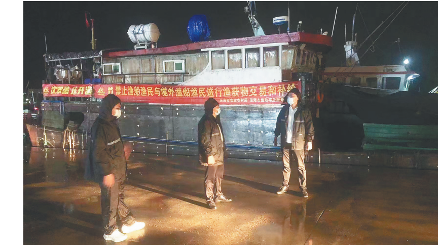
琼海市农业农村局党员在潭门镇中心渔港巡查。

供通行证件，工作人员时常加班加点，没有怨言。8月8日以来，琼海市农业农村局累计办理农业重点物资方面通行证近1000张，保证了琼海大型养殖场饲料运输、农产品水产品运输车辆通行，确保各类民生物资畅通无阻。 值得一提的是，琼海市农业农村局与琼海市供销合作社成立琼海市疫情防控期间农业生产互助共济工作专班，下设种植业生产保供、畜牧业生产保供、渔业生产保供及农产品运销等工作小组，高效统筹疫情防控和农业生产销售，集中解决疫情期间农业生产、农资供应、农产品运输、质量安全监管等方面的堵点难点。 从田间地头到海上防线，不论是烈日当空还是风雨交加，都能看到琼海农业农村局党员的身影。他们用实际行动诠释入党的铮铮誓言，真正做到党旗树起来、党徽戴起来、党员站出来。琼海市农业农村局机关党委有关负责人表示，农业农村局各级党组织和广大党员干部将继续统筹好疫情防控 and 农业生产销售工作，以实际行动展现农业干部精神风貌，让党徽闪耀疫情防控第一线。 （撰文/陈纸仪）