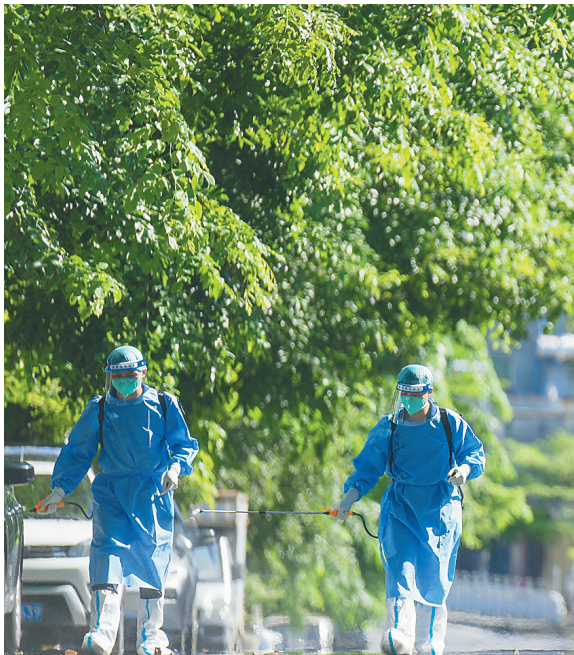
广东援琼消杀队在万宁礼纪镇内各个街道开展消杀工作。