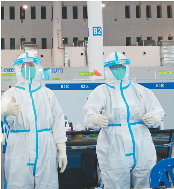
广西援琼医疗队队员在海口方舱医院工作。