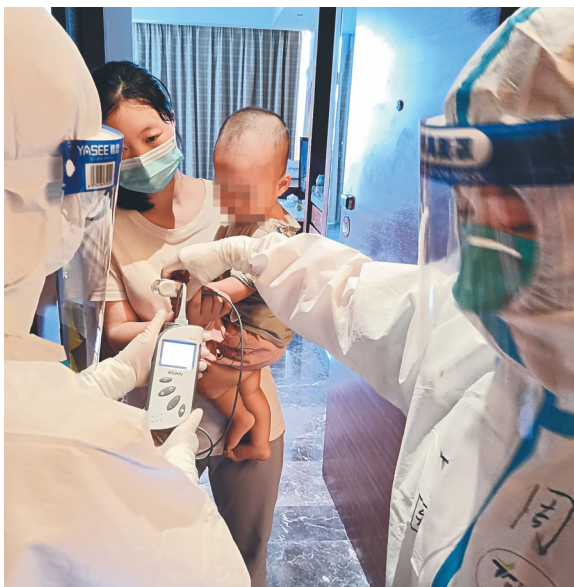
在三亚第四酒店方舱医院内，湖北援琼医疗队队员为患者提供精准服务。