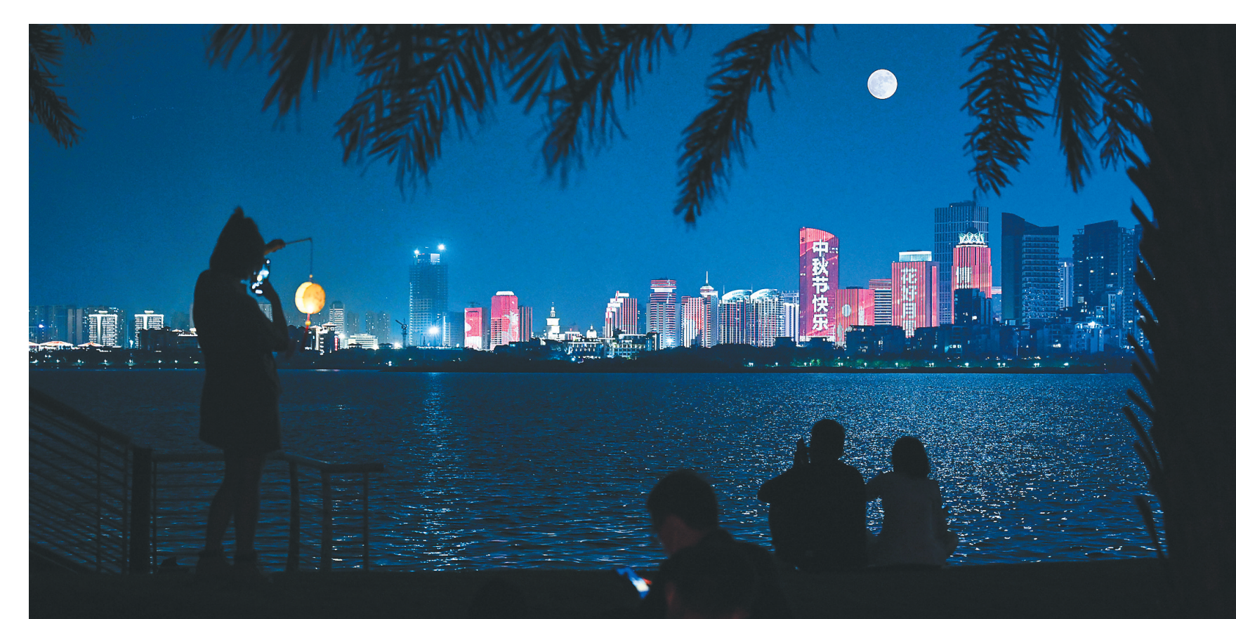
9月10日,海口市丽晶路,市民们相约在海边赏月过中秋。(二次曝光拍摄)

“下次来三亚时,我带你们去看日出日落”,这句话成了黎叔留给大家最真挚的承诺。(本报三亚9月10日电)