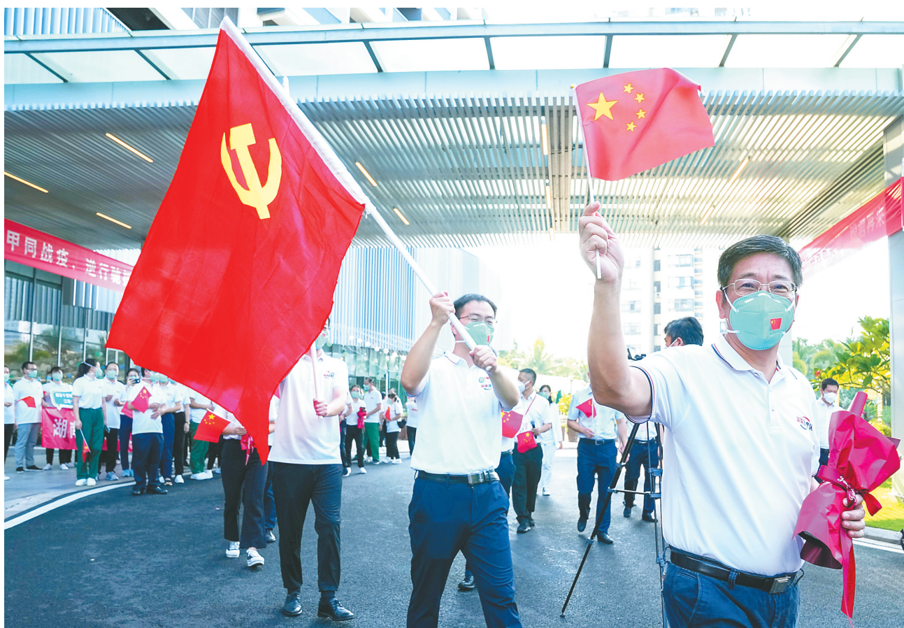
9月12日，三亚欢送完成抗疫任务的湖南省援琼医疗救治队，644名队员踏上返程之路。

截至目前，海南实行告知承诺的涉企经营许可事项达111项，数量居全国第一；涉企经营许可事项由“优化审批服务”改为“实行告知承诺”后，审批环节平均压减70%以上，时间平均压减95%以上。