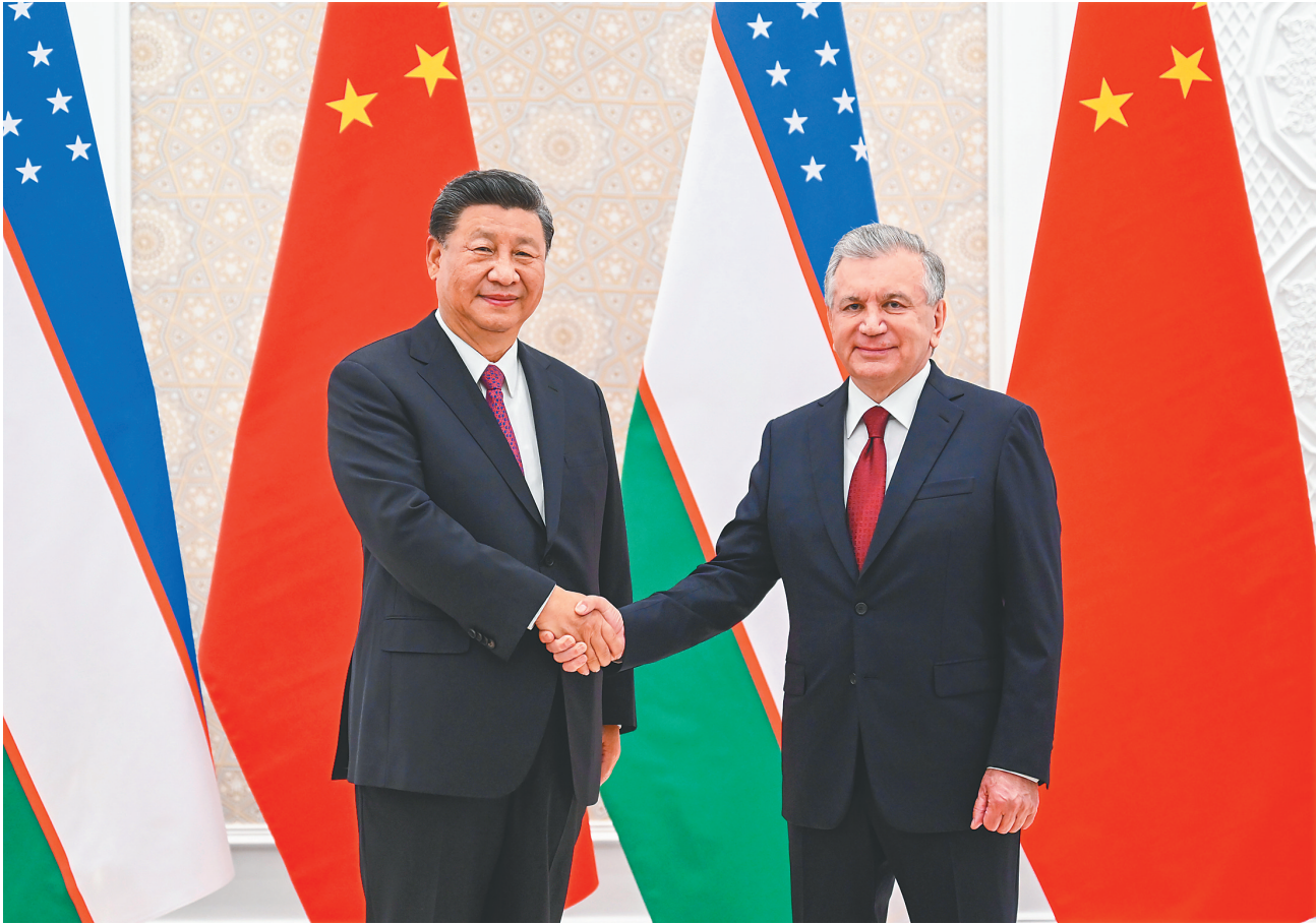
当地时间9月15日，国家主席习近平在撒马尔罕同乌兹别克斯坦总统米尔济约耶夫会谈。

新华社乌兹别克斯坦撒马尔罕9月15日电 （记者倪四义 范伟国）当地时间9月15日，国家主席习近平在撒马尔罕同乌兹别克斯坦总统米尔济约耶夫会谈。两国元首宣布，着眼中乌关系长远发展和两国人民未来福祉，双方将扩大互利合作，巩固友好和伙伴关系，在双边层面践行命运共同体。 金秋时分的撒马尔罕，阳光灿烂，秋高气爽。新近落成的国际会议中心独具匠心，恢宏大气。 当地时间上午9时45分，习近平乘车抵达国际会议中心，米尔济约耶夫在下车处热情迎接。在米尔济约耶夫陪同下，习近平穿过兼具浓郁乌兹别克斯坦民族传统元素和现代时尚设计的中央大厅，前往北门外广场。 米尔济约耶夫为习近平举行隆重欢迎仪式。两国元首共同登上检阅台，军乐团奏中乌两国国歌。习近平在米尔济约耶夫陪同下检阅仪仗队。两国元首分别介绍各自陪同人员，并共同观看分列式。 欢迎仪式后，两国元首举行正式会谈。 习近平指出，中乌建交30年来，两国始终相互尊重、睦邻友好、同舟共济、互利共赢，持续深化战略互信，不断扩大互利合作，全面弘扬世代友好，将中乌关系提升到了全面战略伙伴关系的新高度，为两国共同发展繁荣提供了强大动力。作为乌兹别克斯坦的好朋友、好伙伴、好兄弟，中方坚定支持乌兹别克斯坦走符合本国国情的发展道路，支持乌方维护国家独立、主权、安全和社会稳