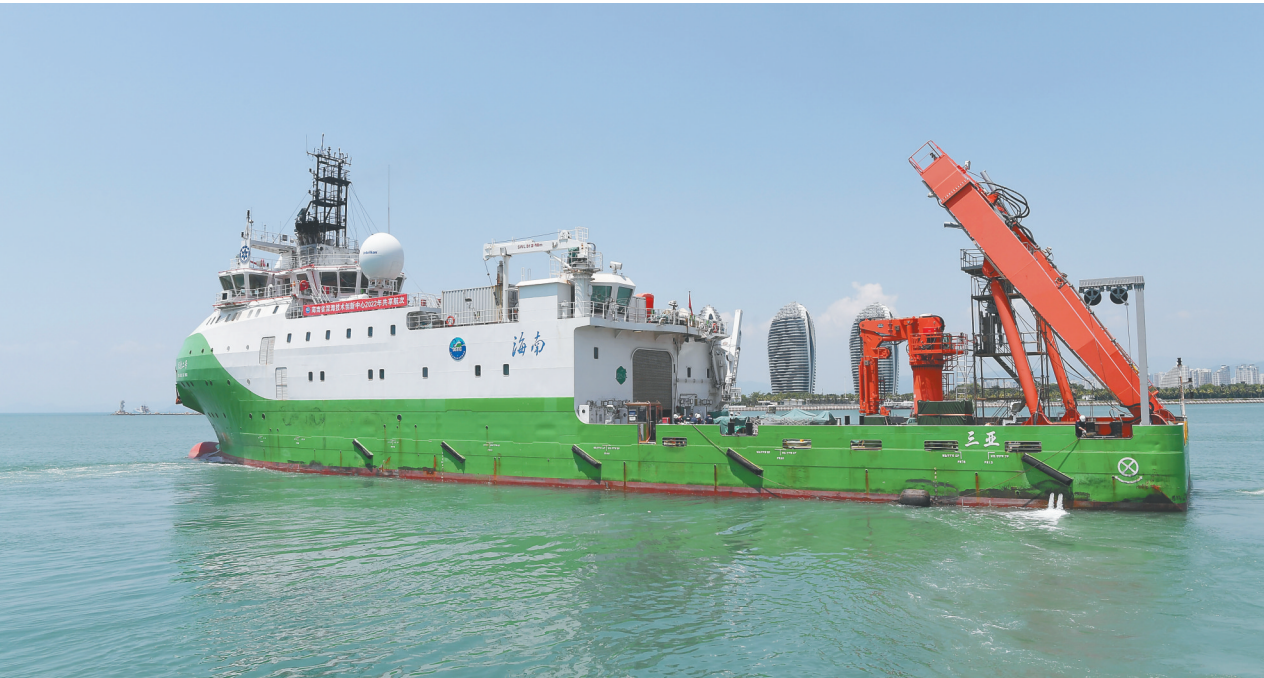
9月16日，“探索二号”从三亚出发，前往南海执行科考任务。

本报三亚9月16日电（记者黄媛艳）9月16日，“探索二号”搭载着“深海勇士”号载人潜水器和60名科考人员，从三亚出发前往南海，执行由海南省深海技术创新中心组织的“深海深渊科考与装备海试共享航次”科考任务。 “探索二号”科考船和“深海勇士”号载人潜水器本航次计划前往南海执