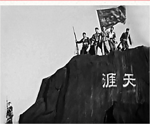
胜利的旗帜插到天涯海角。

琼文抗日根据地靠近府海地区，是日军军事进攻的重点。琼崖抗日独立总队灵活运用战术，痛击日军，发出“我琼崖不可亡，我中华不可辱”的强音。1942年10月，日军集中大批兵力在琼文抗日根据地地进行“扫荡”“蚕食”。琼崖抗日独立总队第一、第二支队和各级地方党组织坚决执行琼崖特委的方针政策，当日军集中“扫荡”时，立即掩护群众安全转移，坚壁清野。同时及时了解日军的动态，组织精干的游击小组和武装工作队开展游击战，消灭日军有生力量。反“扫荡”、反“蚕食”期间，活动在琼文抗日根据地的琼崖抗日独立总队各主力部队和琼山县委及其领导下的县、区常备中队、常备队连续挫败日伪军的阴谋，歼灭了部分日军。比如，在反“蚕食”“扫荡”期间，琼崖抗日独立总队第一支队在琼山县、区常备中队等地方武装的配合下，在三江、苏寻三、云龙等地多次伏击截击日伪军，歼灭日军300多人。