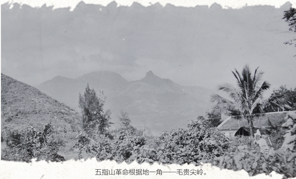
五指山革命根据地一角——毛贵尖岭。