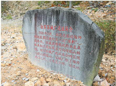
母瑞山革命根据地红军军械厂遗址。