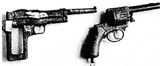
抗战时期琼崖抗日独立总队指挥员用过的手枪。资料图

1948年，为解决部队作战时武器弹药的不足，琼纵决定成立军工局，从各总队军械所抽调一批优秀的技术人员，大力发展军火生产。