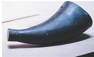
牛角火药桶。资料图