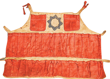
白沙民族博物馆收藏的琼崖革命战士用过的子弹袋。

人好转移，可原料怎么办？面对复杂严峻的形势，该厂党支部决定将炸药和铜铁等原材料藏在桥墩下、埋在稻田里，甚至还在水底建立了一座“地下仓库”。