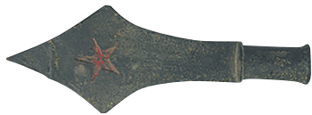
20世纪30年代琼崖工农红军标枪头。

琼崖革命地处孤岛，远离中央缺少外援，当时琼崖社会经济又十分落后，工业基础几乎为零，且敌人对琼崖纵队（以下简称“琼纵”）实行海上封锁，武器弹药和其他物资运不进来，中央想支持也很难。但是搞武装斗争又不能没有武器装备，怎么办？