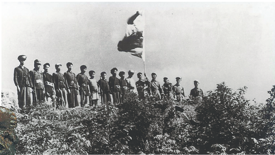
1950年，人民解放军与琼崖纵队在五指山会师。本文配图为资料图