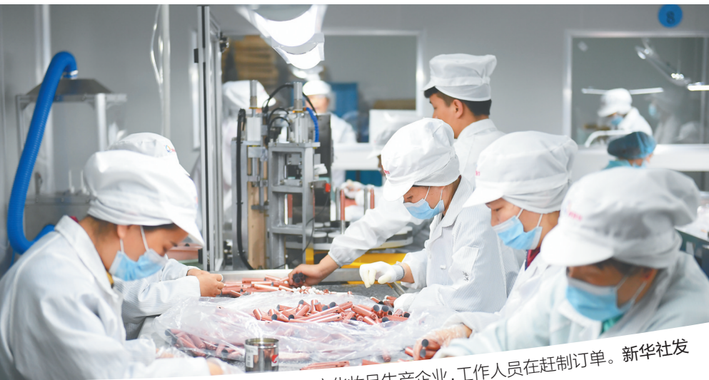
在潮州市吴兴区埭溪镇“美妆小镇”内的一家化妆品生产企业，工作人员在赶制订单。