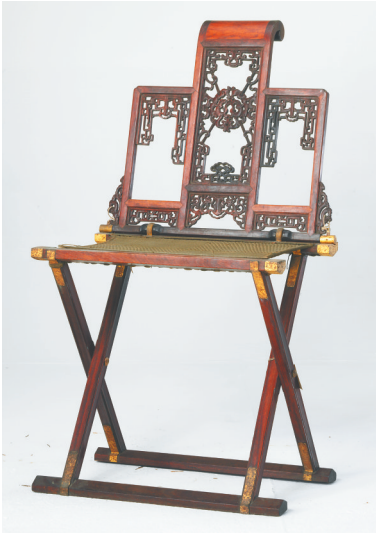
黄花梨雕花纹折椅。资料图

进入21世纪后，黄花梨家具成为市场上的“宠儿”，不仅海南掀起了一股黄花梨收藏热，北京、上海、广东等地也有不少人收藏海南黄花梨家具。与之相对应的是，海南黄花梨心材价格一路水涨船高。