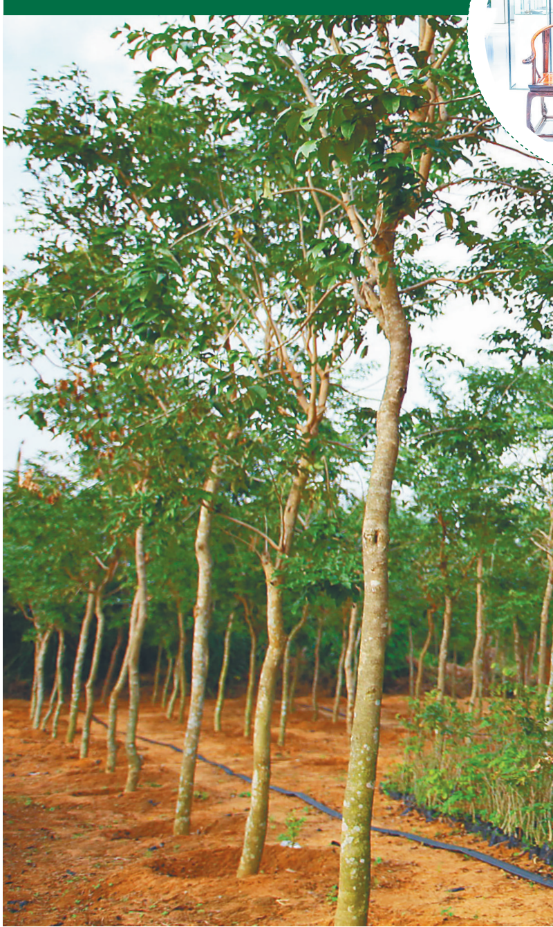
海南黄花梨。