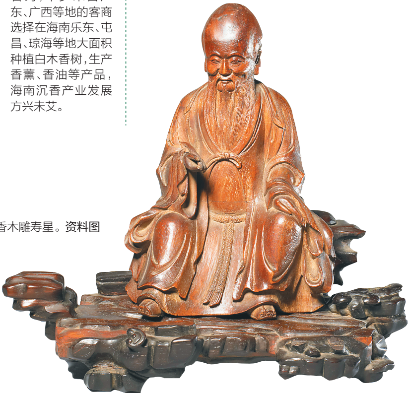
沉香木雕寿星。资料图

如今，海南沉香仍是优质沉香的代名词，不少来自广东、广西等地的客商选择在海南乐东、屯昌、琼海等地大面积种植白木香树，生产香薰、香油等产品，海南沉香产业发展方兴未艾。