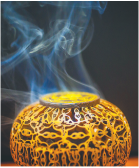
正在焚香的香炉。

能产生沉香的植物包括瑞香科沉香属的21个种、拟沉香属的7个种。据《中国植物志》记载，中国有2种沉香属植物，分别是白木香和云南沉香。