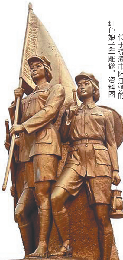
位于琼海市阳江镇的红色娘子军雕像。资料图