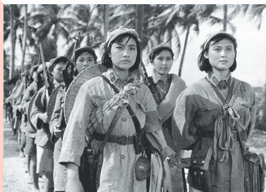
电影《红色娘子军》剧照。资料图

中共海南省委党史研究室编著的《中国共产党海南历史》（第一卷）指出：“红色娘子军这支在中共琼崖特委领导下，组织完整、纪律严明、斗争英勇的妇女武装队伍，尽管战斗历程只有一年多时间，但它深刻反映了琼崖革命动员群众、组织群众的广度和深