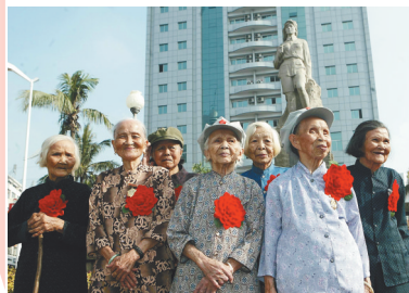
2006年4月30日，7名红色娘子军老战士在琼海市嘉积镇的红色娘子军雕像前合影。

度，在琼崖革命史上写下了光辉的一页，它是中国人民革命斗争史上的一个创举，也是世界妇女争取解放斗争的光辉典范。”