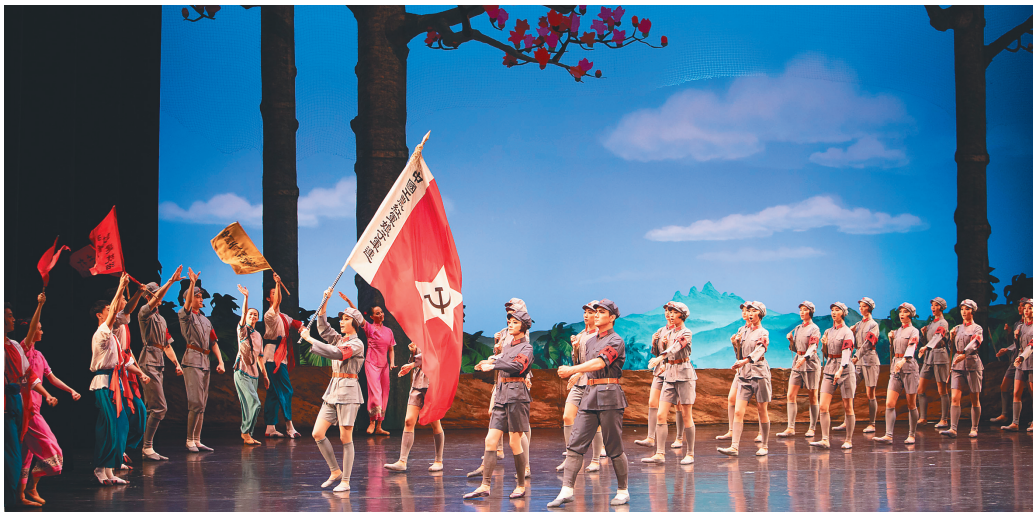
2019年7月9日，中央芭蕾舞团在海南省歌舞剧院演出红色经典芭蕾舞剧《红色娘子军》。

漫步于琼海市阳江镇墟，一座由3名女战士组成的群体雕像映入眼帘，她们头戴红五星八角帽，有的手握军旗，有的肩挎长枪、身背斗笠，昂首挺胸注视着前方，面容坚毅，英姿飒爽。1931年5月1日，在琼崖乐会四区（今琼海阳江镇一带）诞生了一支中共琼崖特委领导的由女青年组成的革命武装——中国工农红军第二独立师第三团女子军特务连，即红色娘子军。这支充满传奇色彩的队伍虽然存在时间不长，但在琼崖武装斗争中具有重要地位。