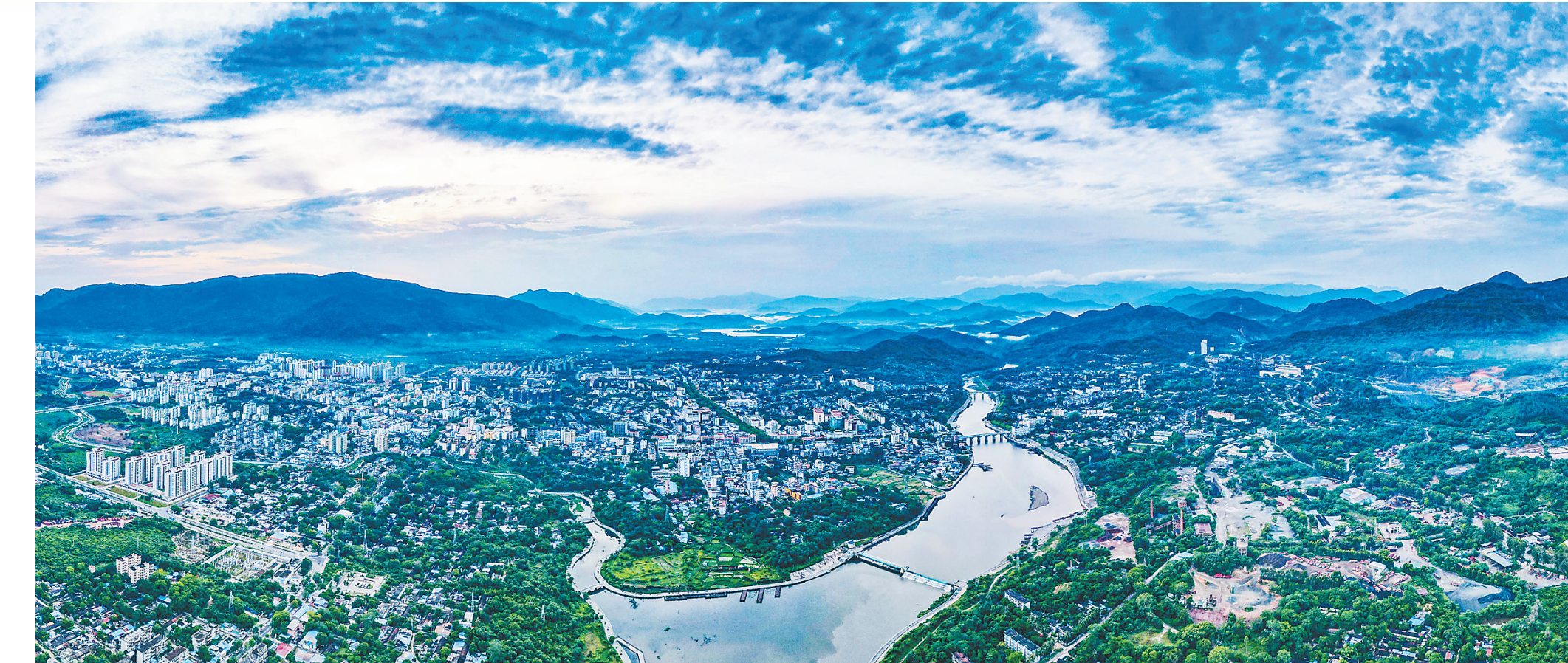
航拍昌江黎族自治县石碌镇。

2021年,海尾镇引进企业发展金鲳鱼养殖产业,建成25口网箱,投苗达到500万尾。同时与社区居委会合作,