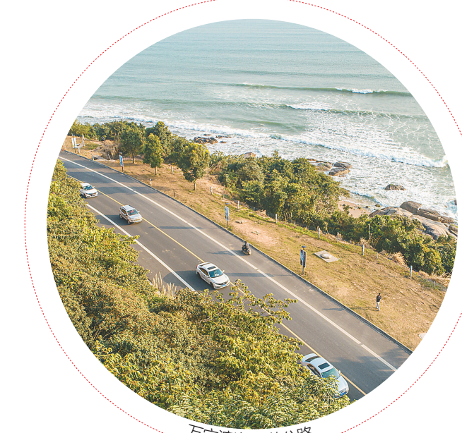
万宁滨海旅游公路。

当时的双方合作办学推行的几个举措在海南尚属首次:学校管理体制采取“理事会领导下的校长负责制”,理事会由万宁市政府及北师大双方共同组成,赋予校长在人事管理、财务管理、设备设施管理、教育教学管理等方面更多的办学自主权;全体教师