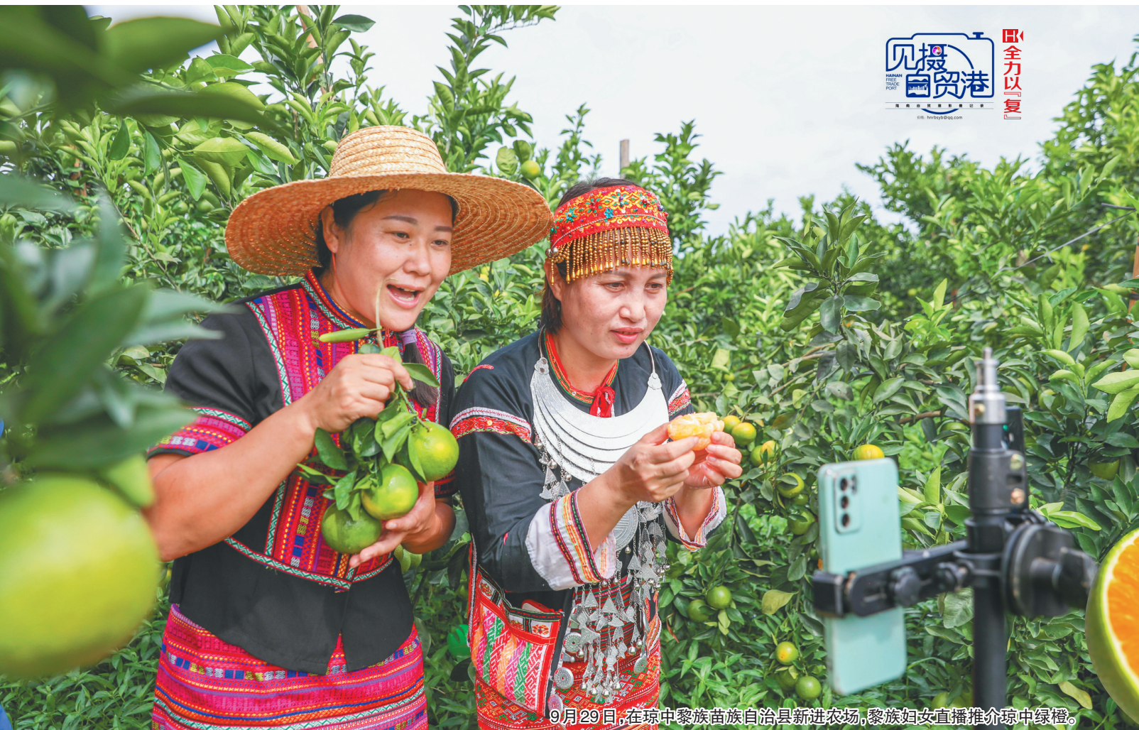
9月29日,在琼中黎族苗族自治县新进农场,黎族妇女直播推介琼中绿橙。