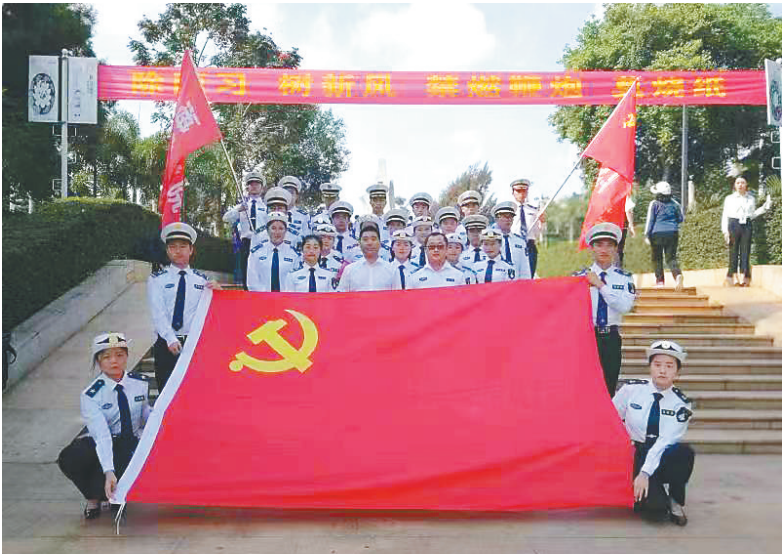
海事学院师生参与海事知识推广活动。