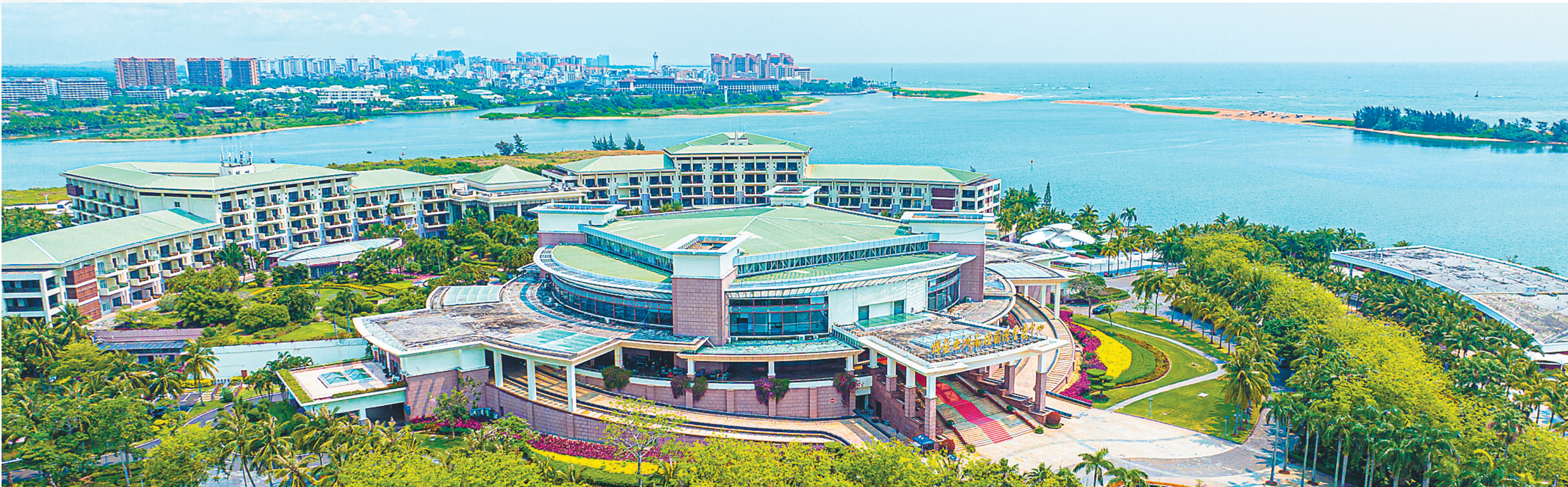
航拍博鳌亚洲论坛会议中心。成立20多年来,博鳌亚洲论坛年会已经成为兼具亚洲特色和世界影响力的国际交流平台,不断为世界发展贡献“中国智慧”“博鳌方案”。