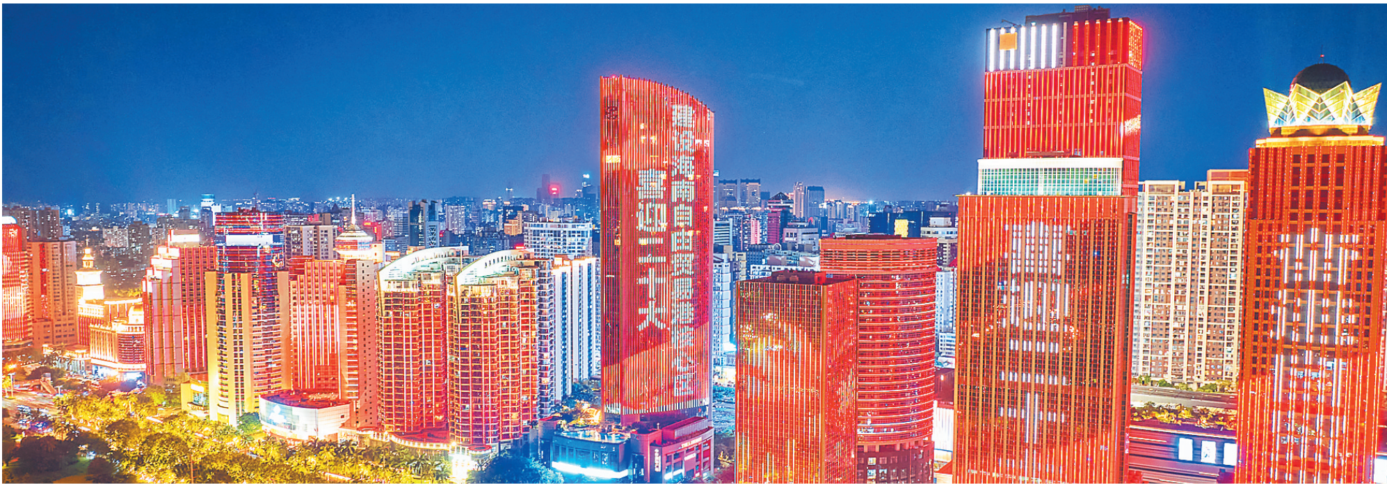
十月十五日，海口市滨海大道楼宇群上演主题灯光秀，喜迎党的二十大胜利召开。