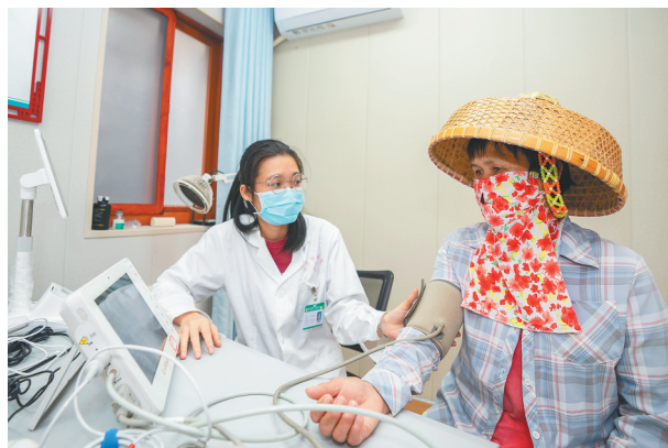
在琼海市博鳌镇沙美村卫生室的5G诊室,全科医生用“健康一体机”为村民检查身体状况。