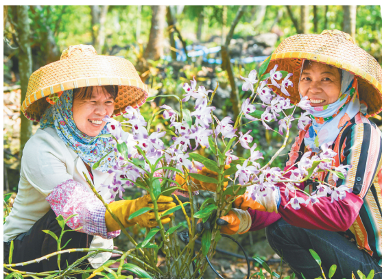
海口石山镇施茶村火山石斛园里,村民在管护石斛花。 本报记者 李天平 通讯员 宁远 图文