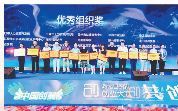
5月31日，2021年度海南自贸港创业大赛颁奖典礼在海口举行。(资料图)