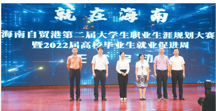
5月9日，海南自贸港第二届大学生职业生涯规划大赛暨2022届高校毕业生就业促进周在海南师范大学启动。(资料图)

人；与33家创业服务、孵化、投融资机构等联合搭建“创业超市”；新增认定6家海南青年(公共)创业孵化基地。目前，2022年海南自贸港创业大赛省外邀请赛决赛已在海口圆满结束。此次大赛共有116个项目报名，其中106个项目通过审核和进入复赛，30个项目晋级决赛，有12个项目获奖。此次大赛紧扣海南各项产业发展需求，以创新引领创业、创业带动就业为核心，借助海南自贸港的政策、资源等优势，为有意愿来海南自贸港落地的省外创业者提供项目交流展示平台，吸引他们参与海南自贸港建设和发展。