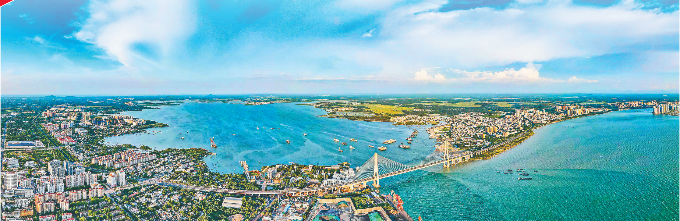
航拍新英湾全景。