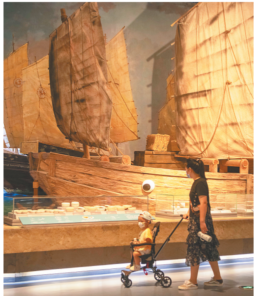
游客在中国(海南)南海博物馆参观。

如今,一系列群众性精神文明创建活动正在琼海百花齐放。文明之光在点亮群众生活的同时,引领了琼海积极向上、健康和谐的时代新风尚。