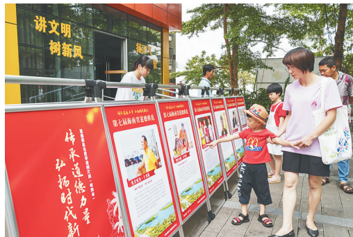
琼海道德模范先进事迹展吸引市民观看。

据统计,截至目前,琼海已推荐12户家庭获评省级文明家庭,推荐15户家庭获评省级最美家庭,1户家庭入选全国最美家庭;评选“星级文明户”83332户,“绿色家庭”150户;累计创建全国文明城市8个,省级文明村镇18个,市级文明村镇128个,文明生态村2643个,实现省级文明生态村创建覆盖率100%的目标。