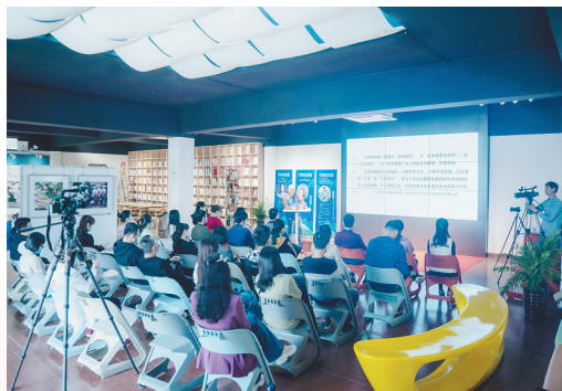
新时代文明实践中心万泉河分中心万泉河讲堂开设《琼海民间手艺人》讲座。