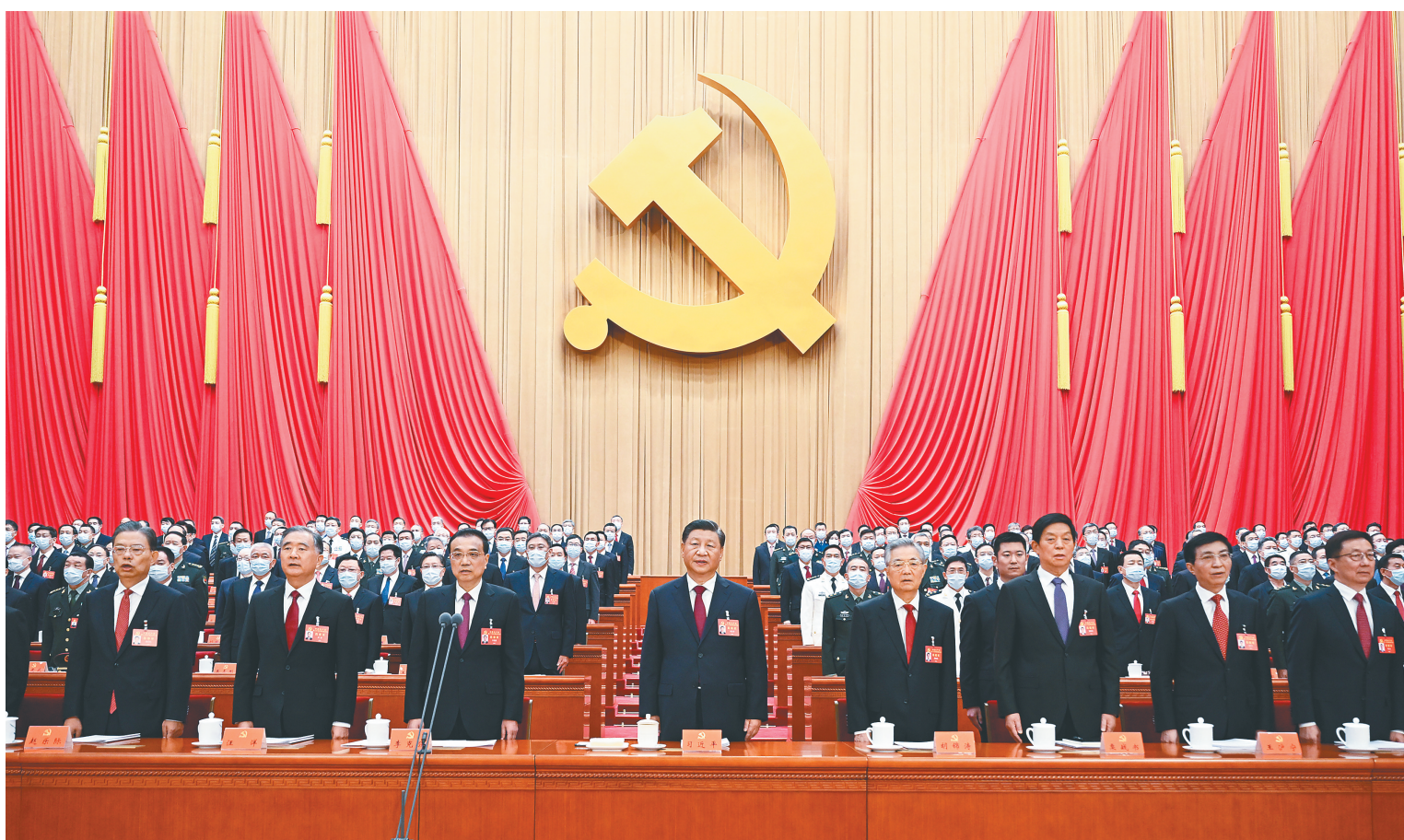
10月16日，中国共产党第二十次全国代表大会在北京人民大会堂开幕。这是习近平、李克强、栗战书、汪洋、王沪宁、赵乐际、韩正、胡锦涛在主席台上。

新华社北京10月16日电 凝心聚力擘画复兴新蓝图，团结奋进创造历史新伟业。举世瞩目的中国共产党第二十次全国代表大会16日上午在人民大会堂开幕。