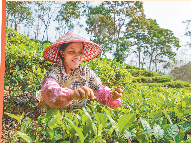
五指山市水满乡毛纳村村民在采茶。