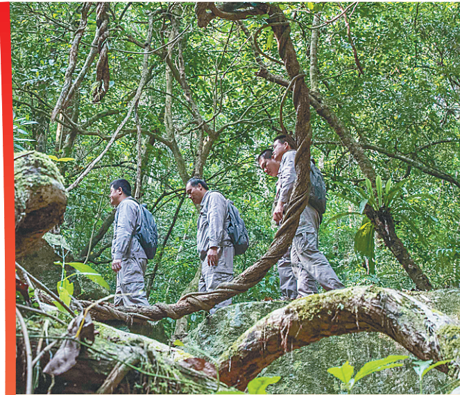
海南热带雨林国家公园五指山片区护林员开展日常巡护工作。