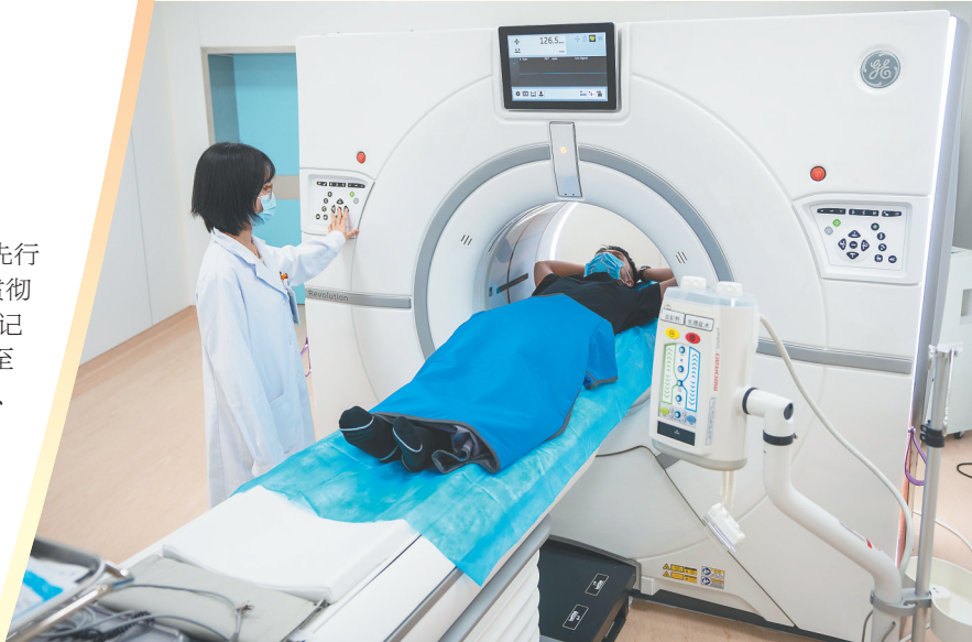
在乐城先行区，瑞金海南医院（博鳌研究型医院）医生用高端CT设备为患者检查身体。

秋风送爽，椰林飒飒。看着乐城先行区工地上热火朝天的建设景象，代晓龙语气爽朗：“我们有信心、更有底气，守护好人民群众生命健康，为健康中国建设作出新的更大贡献！”（本报博鳌10月18日电）