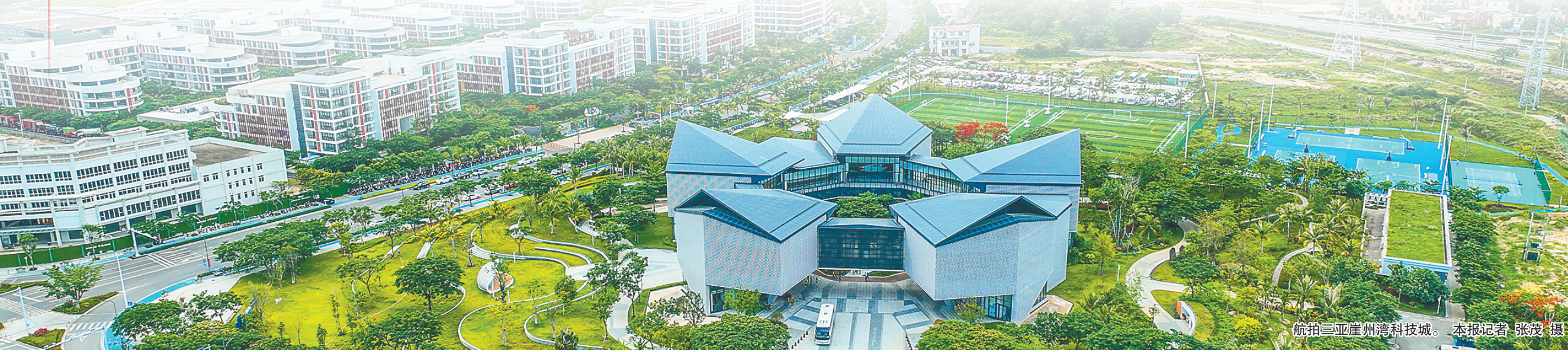
航拍三亚崖州湾科技城。