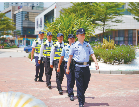
“新安巡防”在新埠岛日常巡逻。

10月16日，新埠海岸派出所中央半岛警务室正式启用，也标志着中央半岛智慧安防社区建设取得阶段性成就。至此，整个社区各类摄像头全部接入社区警务室，实现全时段巡查、分析、指挥和防范；民警、辅警、网格员、巡防队员、义警一道，撑起整个社区的安全防护伞；日常走访、治安防范、打击犯罪、化解矛盾、维护秩序、服务群众，社区基层治理警务室一站式解决。