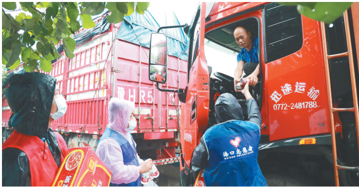
志愿者给待渡车辆的旅客送物资。

“待渡车辆旅客在哪，我们的服务保障就送到哪。”秀英区政府相关负责人介绍，综合服务保障队伍实行24小时值班，分3个班次，全天候为待渡的车辆旅客提供服务保障，直到恢复通航。