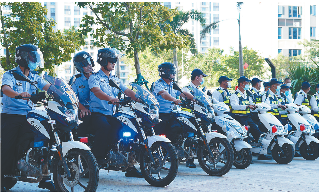
民警带领“新安巡防”队员出发巡逻。