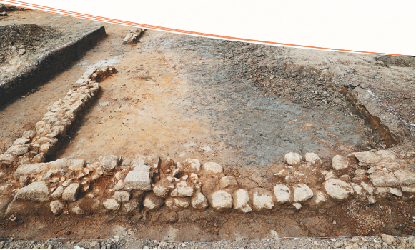
现场出土的青釉碟。