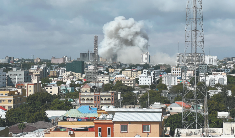
图为在索马里摩加迪沙拍摄的袭击现场升起的浓烟。

新华社莫斯科10月29日电（记者赵冰）俄罗斯29日指责乌克兰袭击参与保障海上粮食走廊安全的俄船只，并宣布暂停参与执行黑海港口农产品外运协议。乌克兰方面回应，俄试图利用“虚假借口”封锁黑海粮食走廊。联合国方面表示正与俄方联系。 俄国防部29日发表声明说，乌克兰当天使用无人机在黑海港口塞瓦斯托波尔对俄黑海舰队船只和民用船只实施“恐怖袭击”，俄方掌握的信息显示袭击在英国海军人员指导下进行。声明还称英军参与策划实施针对“北溪”天然气管道的破坏活动。 俄罗斯外交部发言人扎哈罗娃同日对塔斯社表示，俄方将提请联合国安理会及国际社会关注有关方面在黑海和波罗的海对俄实施的一系列“恐怖袭击”，包括英方参与的相关活动。俄外交部随后发表声明说，俄从即日起无限期暂停落实黑海港口农产品外运协议。 乌克兰外长库列巴同日在社交媒体发文称，俄罗斯方面正式试图利用“虚假借口”封锁黑海粮食走廊。联合国秘书长古特雷斯发言人迪雅里克说，俄罗斯宣布暂停参与执行黑海港口农产品外运协议后，联合国正与俄方联系。各方避免任何危及黑海港口农产品外运协议的行动至关重要。 今年7月，俄罗斯、乌克兰就恢复黑海港口农产品外运问题分别与联合国、土耳其签署协议。协议有效期为120天，将于11月19日到期。俄罗斯常驻联合国代表涅边贾日前表示，鉴于涉及俄罗斯的协议内容未得到有效落实，俄方不排除拒绝协议延期。