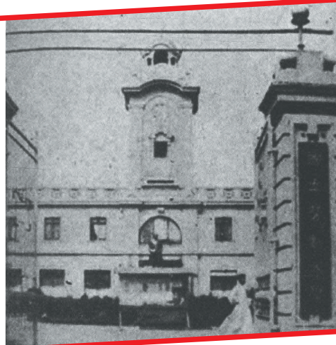
上海大学江湾校舍(1927年4月1日至1927年5月3日)。