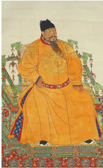
明成祖朱棣像轴（故宫博物院藏）。 本版图片均为资料图