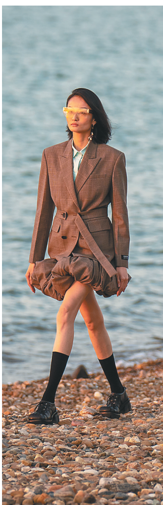
第二届中国国际消费品博览会时装周的海边沙滩秀。

想了解穿搭趋势？想追赶时尚潮流？除了时髦的买手店，第二届中国国际消费品博览会时装周也能满足人们的愿望。不论你是走高贵优雅气质路线，还是钟情个性时髦少女，都能在第二届消博会时装周找到让你心仪的服饰或单品。