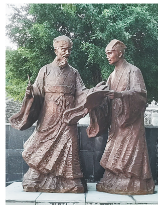
苏轼与姜唐佐雕像。