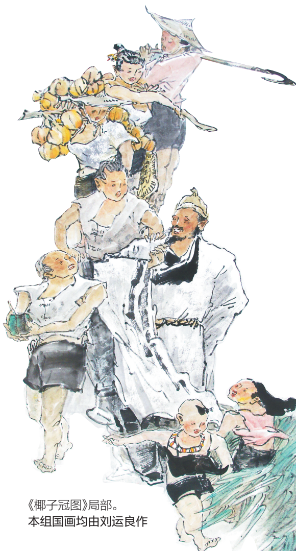
《椰子冠图》局部。 本组国画均由刘运良作