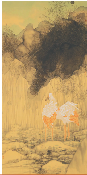
《翠影》(纸本设色) 徐晓荔