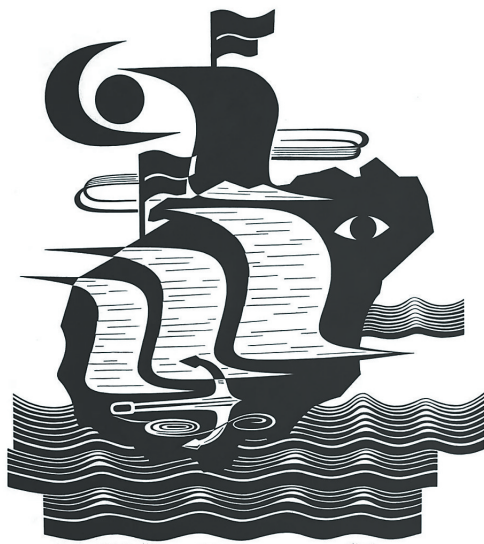
《海南风》(版画) 张地茂