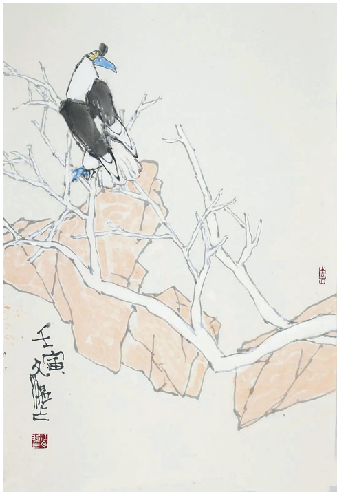
《花鸟》(纸本水墨) 江文俊