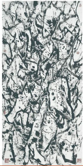
《山崖之六》(纸本水墨) 崔振宽