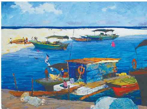
《南海渔歌》(油画) 王家儒