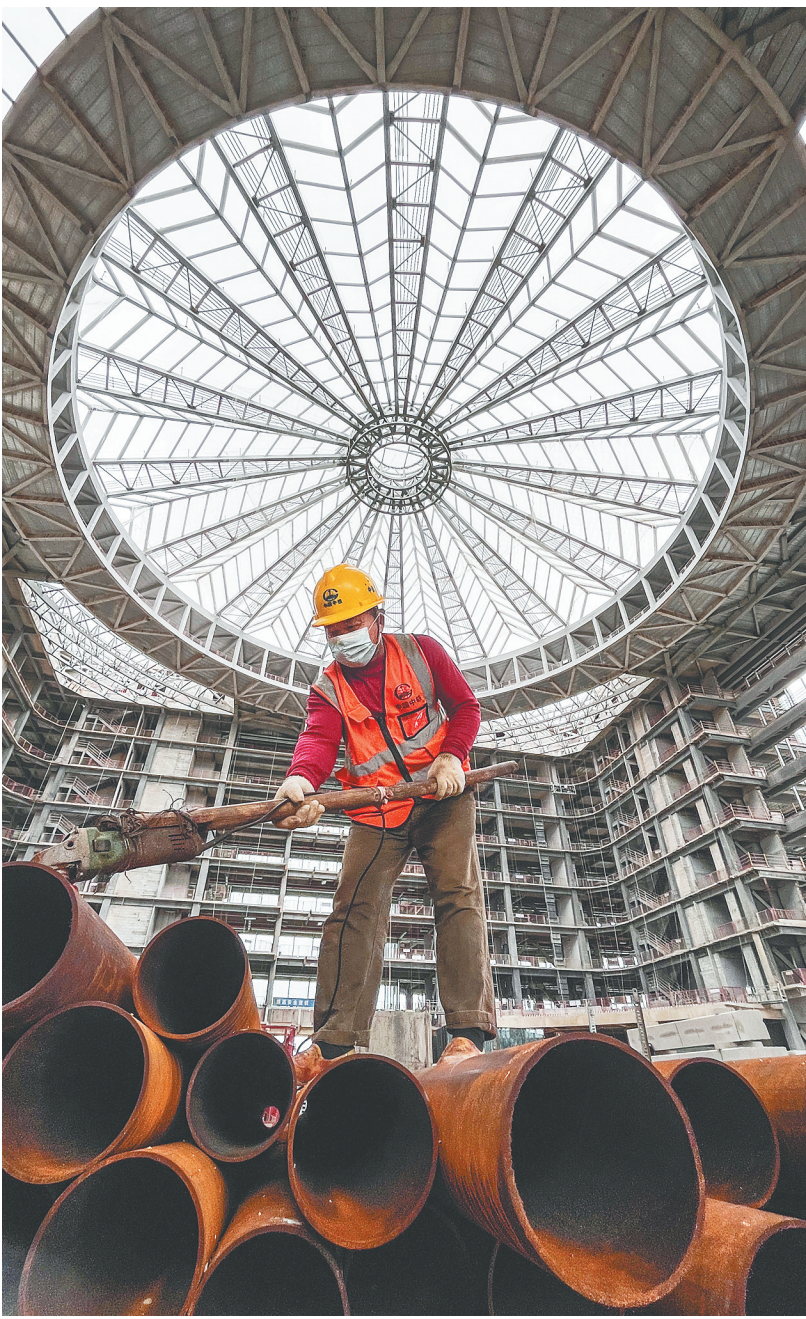
海南银行总部项目现场，一名油漆工人正在给空调管打磨除锈。