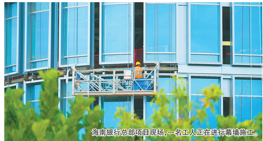
海南银行总部项目现场，一名工人正在进行幕墙施工。

截至10月底，已有两家银行开展试点，共办理业务上百笔约2亿美元，节约纸质材料近2000张，减少企业“脚底成本”近9300公里。